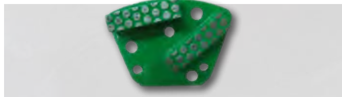
PATIN VERT PREMIUM - POUR SOLS À DURETÉ MOYENNE